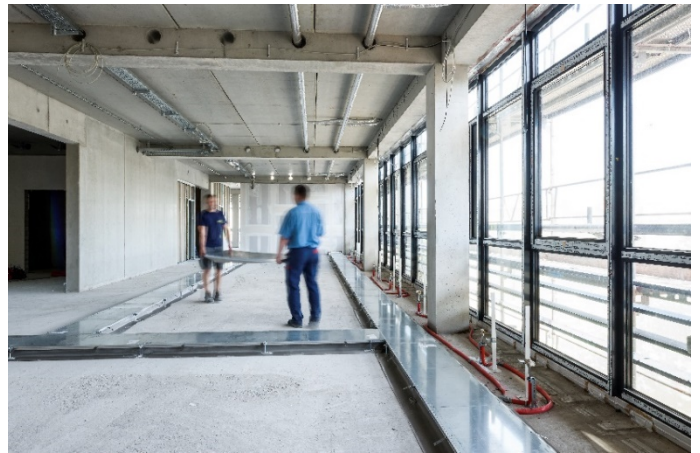
Obr. 5: Montáž inštalačného kanála OKA na stavenisku

Informácie o užitočnom priereze kanálov zo systému OKA poskytujú tabuľky v technické časti. Vďaka nivelácii sa zväčšuje objem kanálu. Pokiaľ sú použité prístrojové jednotky, znižuje sa zodpovedajúcim spôsobom užitočný prierez.