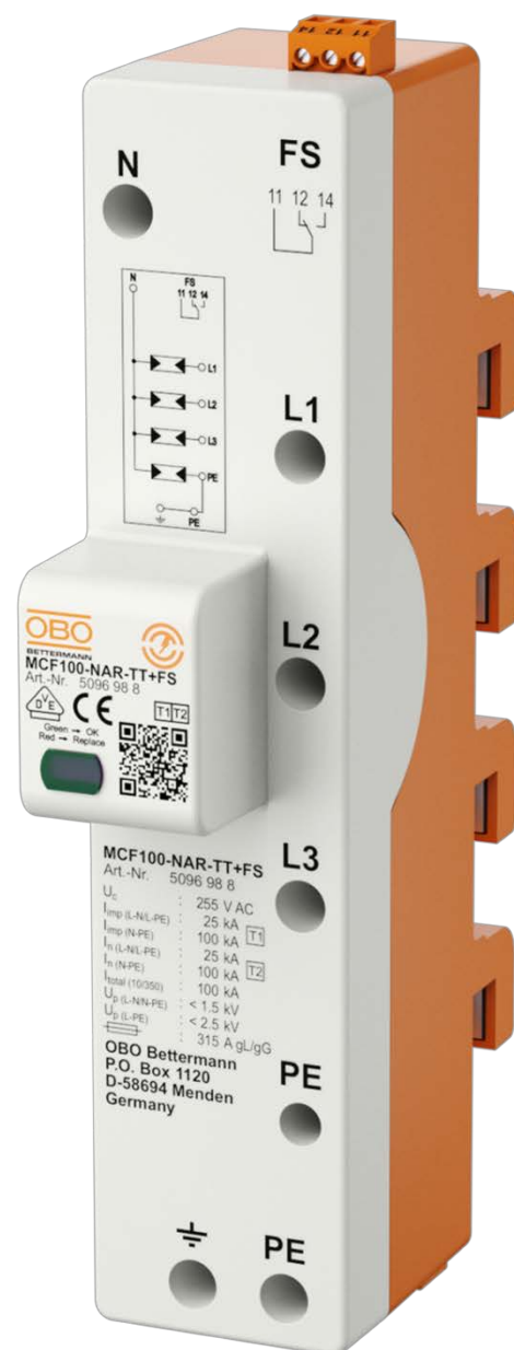
Obr. 2: Prepäťová ochrana pre priamu montáž na systém prípojnic 40 mm