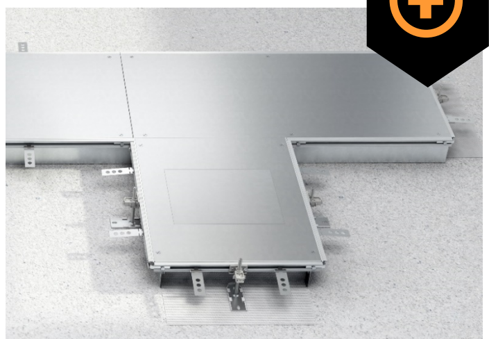
Obr. 7: Kanál OKA-W s prídavnou jednotkou