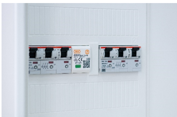
Obr. 1: Montážna skriňa s prepäťovou ochranou MCF-NAR