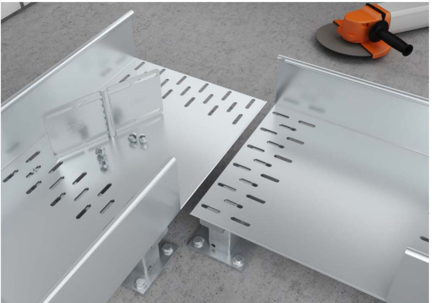
Obr. 4: Použitie ako rohová spojka