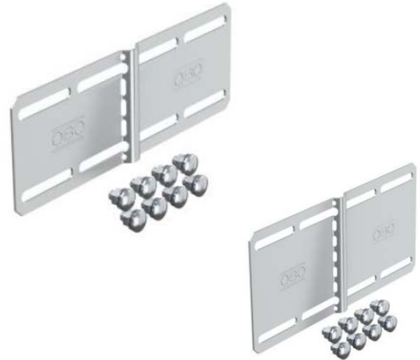
Obr. 3: Univerzálne pozdĺžne spojky s ochranou hrán

Univerzálna pozdĺžna spojka je použiteľná ako priama, aj rohová spojka.