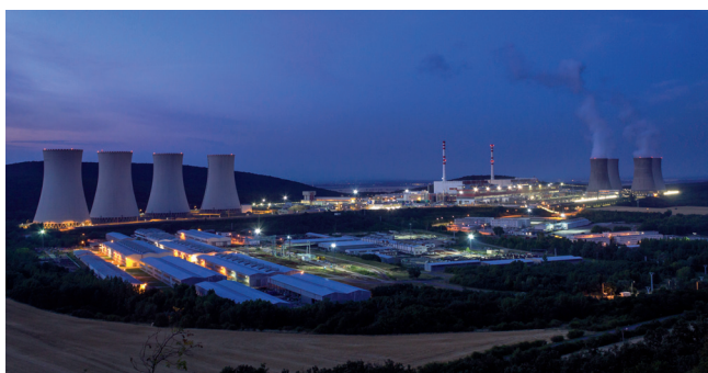
Atómová elektráreň Mochovce