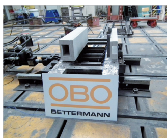
Seizmické skúšky kanála PYROLINE® Con a strmeňových príchytiek s kovovými rúrkami

Veľkosť a rozsah elektrárne sa môže výrazne líšiť od zariadenia k zariadeniu. Jedna vec však vždy zostáva rovnaká: kompetentné a spoľahlivé poradenstvo a podpora partnerov OBO v technickej kancelárii i na stavenisku. V každej fáze projektu sa môžete spoľahnúť