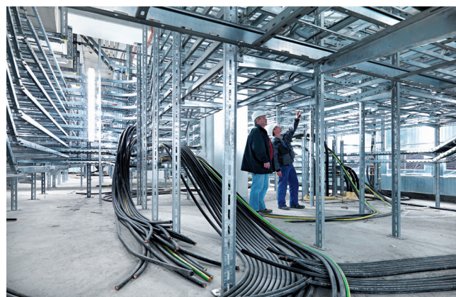
Poradenstvo priamo na stavbách

Žiadne stavenisko pre nás nie je príliš ďaleko. Sofistikovaná logistika OBO zaisťuje, že naše výrobky dorazia na určené miesto včas, rýchlo a spoľahlivo. To je zaručené našou úzko prepojenou predajnou a podpornou sieťou vo viac ako 50 krajinách sveta.